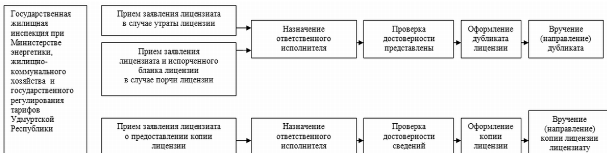
Приложение N 4 к Административному регламенту по предоставлению государственной услуги "Лицензирование предпринимательской деятельности по управлению многоквартирными домами"